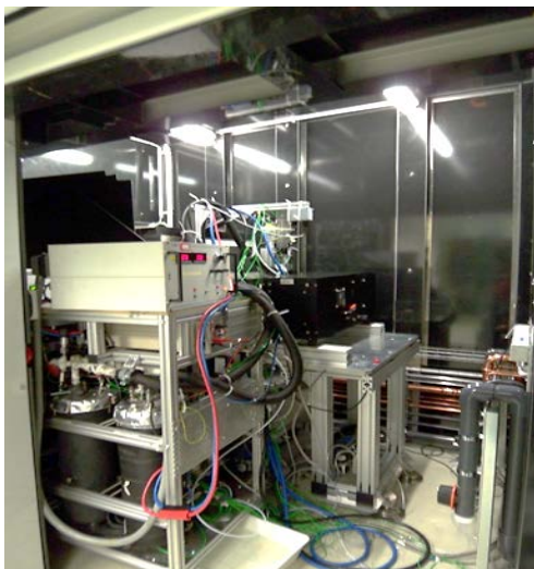
Abb.: Mobiler Teststand (ZSW) im Einsatz bei neutronenradiographischen Untersuchungen

Für alle Messungen mit Neutronen- oder Synchrotron(Röntgen)-Strahlen ist am ZSW ein mobiler Teststand verfügbar (s. Abbildung).