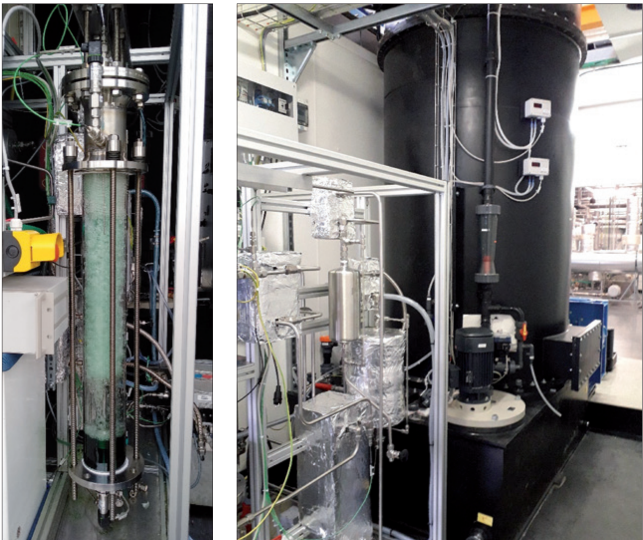
Abbildung 1: CO 2 -Desorber (links); CO 2 -Absorber (rechts) für 0,5 – 1 m 3 /h CO 2 ; 3600 m 3 /h Luft

Bei allen bekannten Verfahren muss im Vergleich zur gewonnenen CO 2 -Menge ein großer Luftvolumenstrom mittels Gebläse durch den Absorber (z. B. Wäscher, Festbettsschüttung, Filter) gefördert werden, was abgesehen von der Desorption, den el. Hauptverbrauch verursacht.